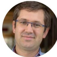
Antoine Godin Agence Française du développement